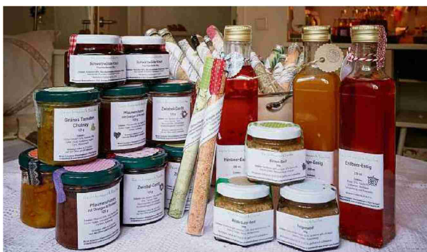
Chutney und Essig. Einige Produkte aus dem Hofladen der Kokemoors.

Hofladen «Miriam's GeschmackSache», Wasenweilerstrasse 4, Ihringen. Der Laden hat auf Anfrage oder jeweils am Freitag von 15–18 Uhr geöffnet. www.miriams-geschmacksache.de